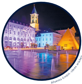
Aliventa GmbH - Ideen erleben

18. August bis 12. September 2021 | Ab Einbruch der Dämmerung