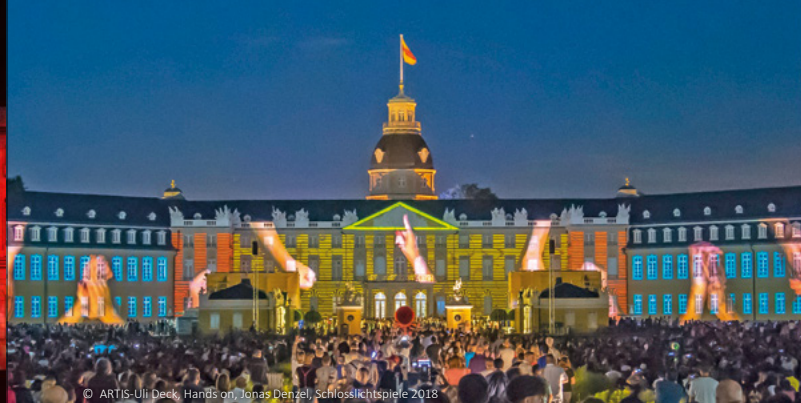
© ARTIS-Ull Deck, Hands on, Jonas Denzel, Schlosslichtspiele 2018