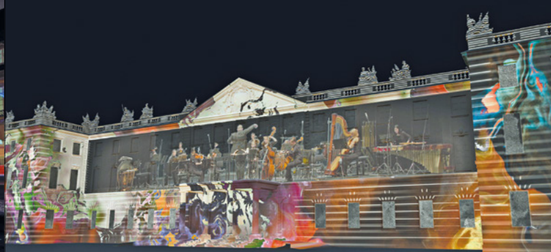
© Nucleus, Hochschule für Musik Karlsruhe, Schlosslichtspiele 2021

18. August | 23. August bis 29. August 2021