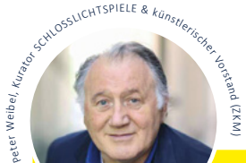
Peter Weibel, Kurator SCHLOSSLICHTSPIELE & künstlerischer Vorstand (ZKM)

»Die SCHLOSSLICHTSPIELE präsentieren einen zweifachen Sog, einen Sog des Sounds, der den Sog der Bilder antreibt. So werden die SCHLOSSLICHTSPIELE zu einem visuellen Gesang des Miteinanders und Füreinanders. Es geht 2021 nämlich gerade darum, die physische Distanz durch die Corona-Pandemie nicht zu einer sozialen Distanz werden zu lassen. Wir müssen das Leben wieder gemeinsam in die Hand nehmen und nach neuen Lebensformen suchen.«