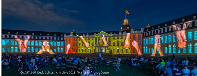
Schlosslichtspiele 2018, "Hands on" Jonas Denzel