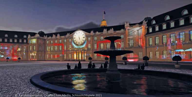
© Karlskompensator, Crushed Eyes Media, Schlosslichtspiele 2021